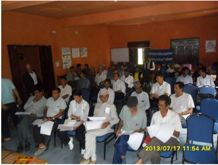
वार्षिक समिक्षा कार्यक्रमका सहभागीहरु