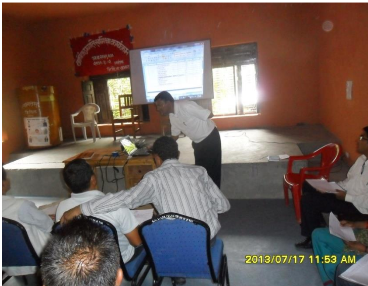
जिल्ला पशु सेवा कार्यालयको प्रस्तुति नियाल्दै योजना अधिकृत