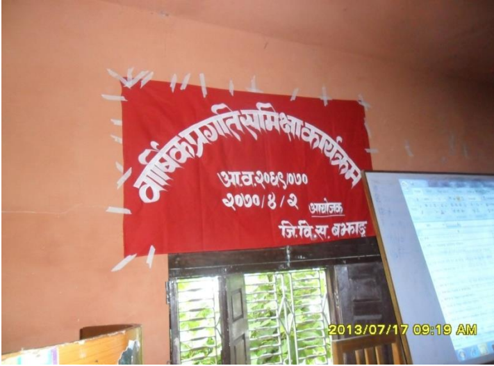
वार्षिक प्रगति समीक्षा कार्यक्रम समुदघाटन समारोह