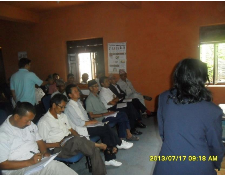
महिला विकास अधिकृत आफ्नो प्रगति वारे प्रस्तुत गर्दै