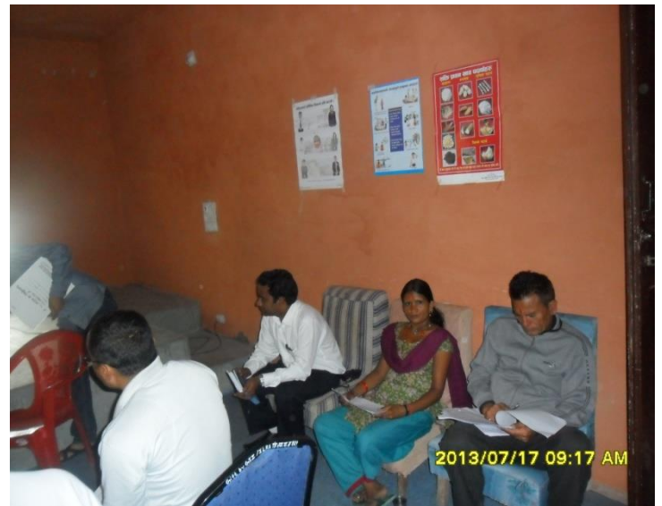
समिक्षामा सक्रिय रुपमा सहभागि हुदै जिल्ला इन्जिनियर