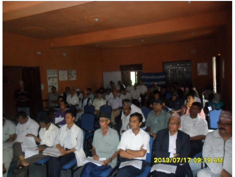
स्थानीय विकास अधिकारी, प्रहरी नायव उपरिक्षक, राजनीतिक दल, कार्यालय प्रमुख, गै.स.स. प्रमुख तथा प्रतिनिधिहरुको उपस्थिति