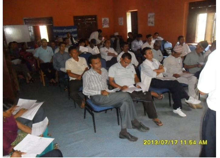
राजनीतिक दलका प्रतिनिधिहरुको उपस्थिति